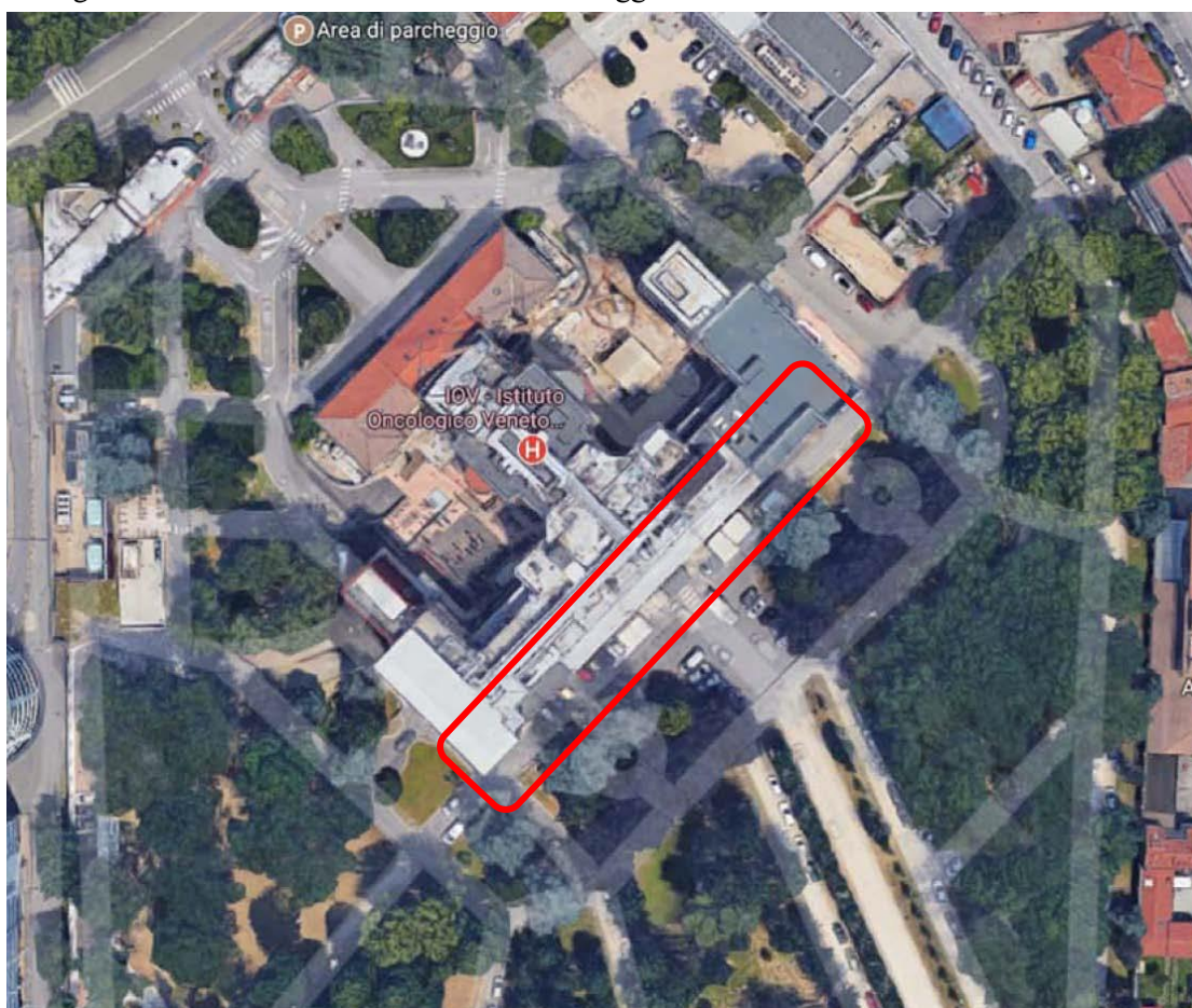
Vista aerea della zona di intervento

Di seguito si mostra la vista dall’alto dell’area oggetto delle lavorazioni.